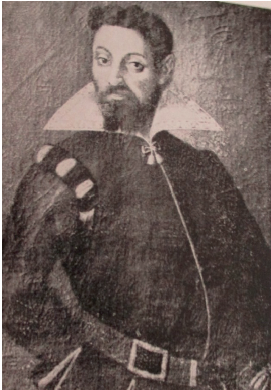
Giovanni Battista Taxis Bordogna

Nel periodo 1545-1563 a Trento si svolse il Concilio, l'assemblea di tutti i vescovi cattolici del mondo per riformare la Chiesa e mettere fine alla divisione fra cattolici e protestanti, seguaci di Martin Lutero. Quell'evento accrebbe la necessità di corse postali fra la Santa Sede, Trento e i vari Stati dell'Europa occidentale. Fu allora che la famiglia Taxis nel 1562 ottenne la patente imperiale per dirigere la posta e garantire i collegamenti fra il Regno di Polonia e l'Europa occidentale.