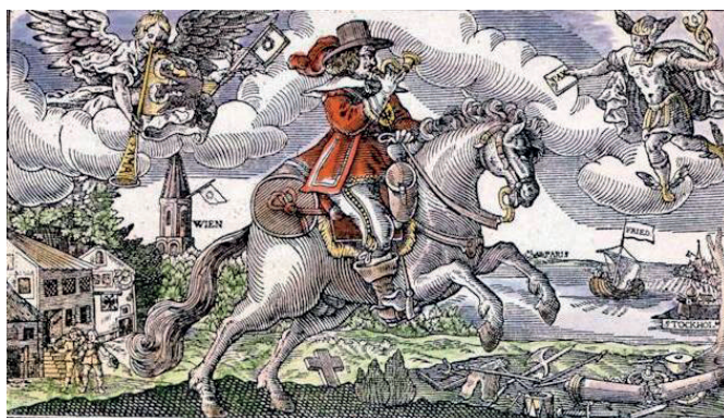
Staffetta postale, incisione del XVII secolo

Il termine “posta” deriva dal nome latino della stazione di cambio dei cavalli creata ai tempi dell'Impero Romano, appunto la mutatio posta , termine poi ripreso dal tedesco Post , un servizio organizzato nel 1490 con l'istituzione di stazioni fra le quali avveniva la consegna delle lettere e dei messaggi; tali stazioni distavano tra loro 37,5 km, ridotta nel 1505 a quindici. Verso la metà del XV secolo furono istituite le corporazioni dei corrieri di trasporto della corrispondenza con centri di smistamento a Roma e Venezia.