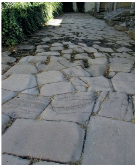
La via romana Annia presso Concordia Sagittaria (VE). Foto del 2017

L'arteria, in seguito, assunse la denominazione di “via imperiale” perché percorsa dai nobili cortei che, attraversato il Passo del Brennero, percorrevano la valle dell'Adige, collegamento tra il Nord-Europa e il Mediterraneo 1 .