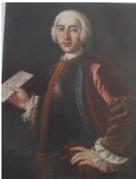
Ferdinando Filippo Taxis-Bordogna, seconda metà del XVIII secolo (Kunsthistorisches Museum, Wien); da Brunet, p. 51 fig. 23.

Il servizio postale amministrato dai Taxis divenne fonte di enormi introiti per le casse imperiali; per tale merito, nel 1642 la famiglia ottenne il titolo baronale e dal 1680 i membri divennero conti ereditari. I Taxis organizzarono il servizio postale lungo quattro principali assi stradali che attraversavano l'Europa, conservando tuttavia la sede centrale a Innsbruck. La statalizzazione del servizio postale avvenne con Decreto dell'imperatrice Maria Teresa, datato 11 novembre 1769. A Giovanni Francesco Taxis-Bordogna-Valnigra venne riconosciuto un indennizzo annuo di 3.479 fiorini, elevati a 4.421 nel 1774 a favore di Ferdinando Filippo Taxis-Bordogna-Valnigra. In quel tempo Segretario del Regio Ufficio di Posta in Trento nel 1784 fu nominato Giovanni Planer 3 .