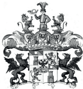
Stemma Taxis Bordogna Valnigra