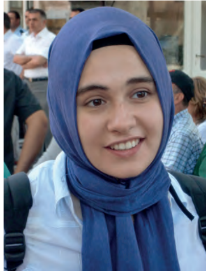
Giovane ragazza a Istanbul.