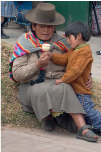
Mamma e figlio, Cuzco, Perù.