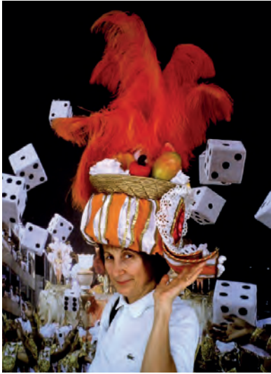
Leda al Sambodromo di Rio de Janeiro.