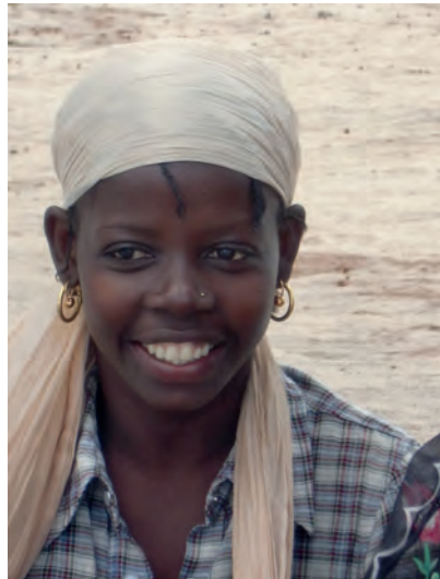
Giovane africana, Mozambico.