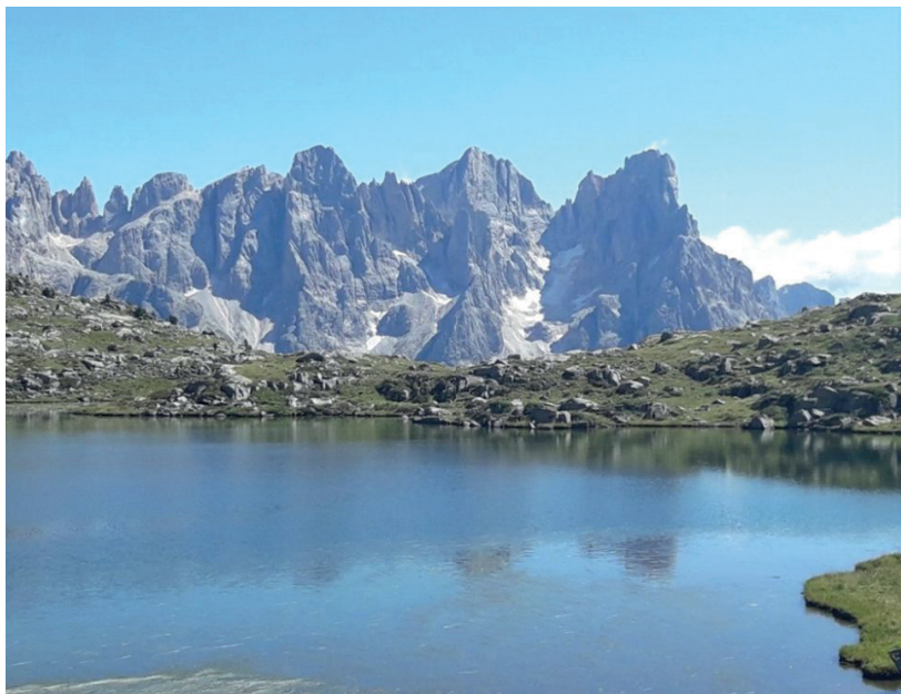
Lago di Juribrutto (m 2206) sulla Catena di Bocche. Sullo sfondo le Pale di San Martino, con Cimon della Pala, Vezzana, Bureloni e Farangole e Mulaz.

Nella prefazione ho dichiarato l'importanza della montagna nella mia vita e nella mia formazione spirituale.