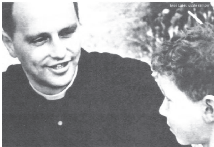
Fig. 7 – Il Profeta in un paterno colloquio con uno dei “ragazzi” della Scuola di Barbiana (primi anni Sessanta del secolo scorso).