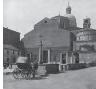
Figg. 4-5 Vedute del lato sud di piazza Duomo tra fine Ottocento e inizio Novecento, e dopo l'apertura di via Vandelli (1904-06). Compare sullo sfondo il volume prismatico in laterizio a vista del palazzo del Vescovo.