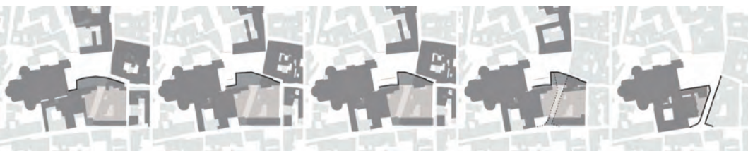
Fig. 3 Evoluzione della forma di piazza del Duomo dalla fine del Settecento allo stato attuale. L'edificio che definisce il lato sud della piazza (in basso nell'immagine) si riduce progressivamente fino a contrarsi nell'apertura di via Vandelli. Dall'esercitazione dell'allieva Francesca Grassetto.

Come accadeva per le più importanti chiese che sorgevano in città, anche il Duomo presentava due aspetti fondamentali nella sua relazione con il tessuto intorno. In base al primo, uno dei lati era interessato da un percorso pubblico che lambiva il fianco dell'edificio sacro: si tratta qui del lato nord, ove tuttavia la relativa facciata della Cat-