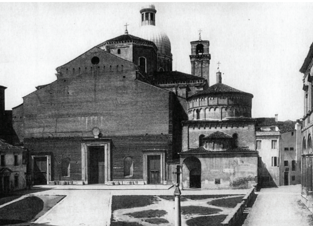
Piazza del Duomo, Padova. Veduta d'epoca.