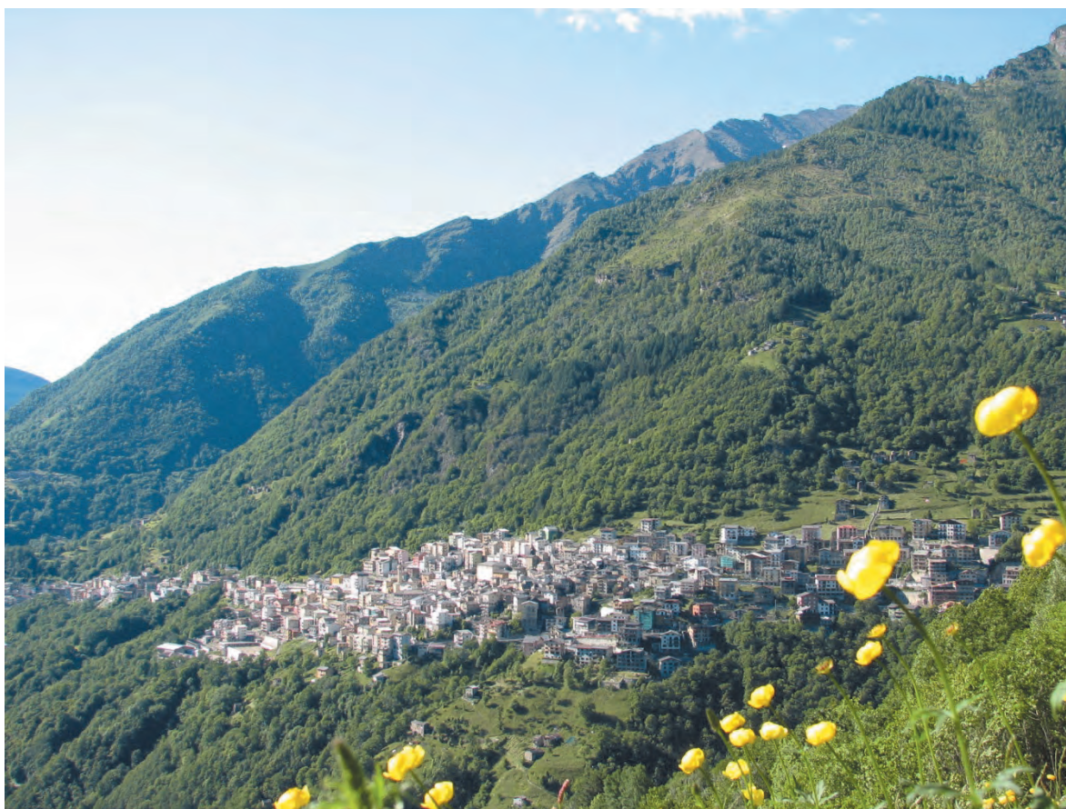
Figura 1. Premana (Lecco), 2006 (AFC).

Storia, vita, documenti, testimonianze e immagini della colonia premanese a Venezia e le vicende della famiglia Ratti